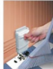
VAC PAN II (VC87)