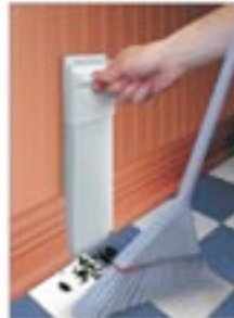
VAC PAN II (VC89)