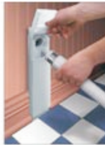
VAC PAN II (VC89)