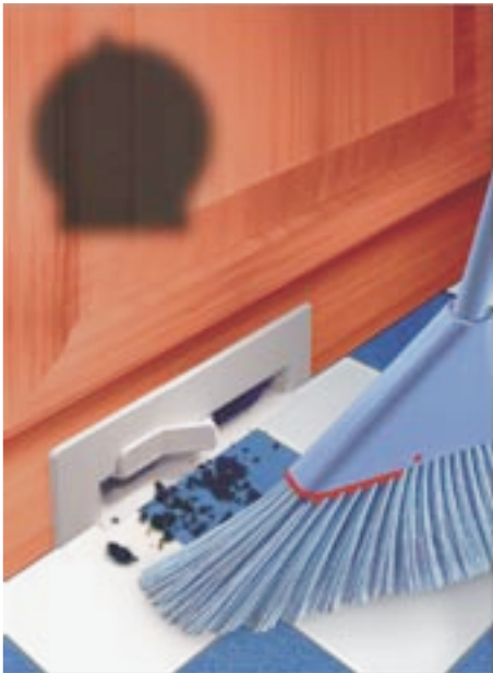
VAC PAN I (VC81-6)