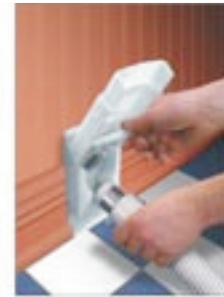
VAC PAN II (VC87)