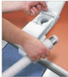
VAC PAN II (VC88)