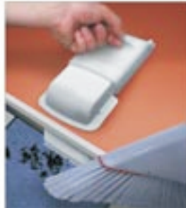
VAC PAN II (VC88)